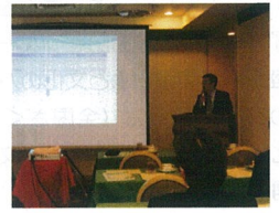
小谷野氏講演の様子