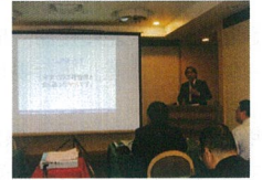
下山氏講演の様子