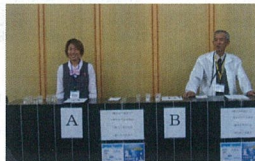
聞き水チャレンジコーナー

解答数168(うち正解数102 正解率64,7%) ミネラルウォーターと深層水の違いが難しかったようです。