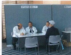
井戸110番相談コーナー