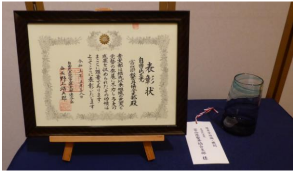
表彰状及び記念品